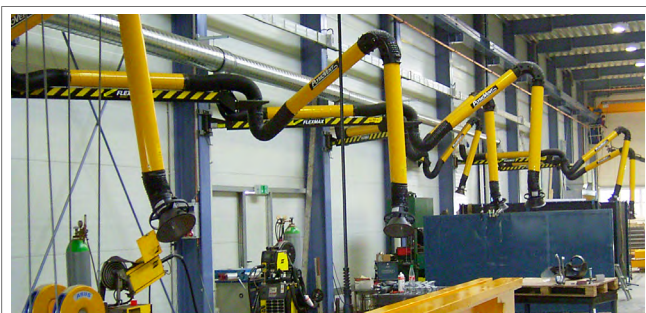
Passar för tunga applikationer